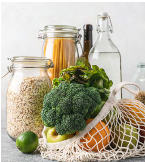
Objectif zéro déchet !

Réduire ses déchets, non seulement c'est possible, mais c'est même urgent pour contrer le changement climatique. « A chaque fois qu'un objet est réutilisé, ce sont des ressources naturelles