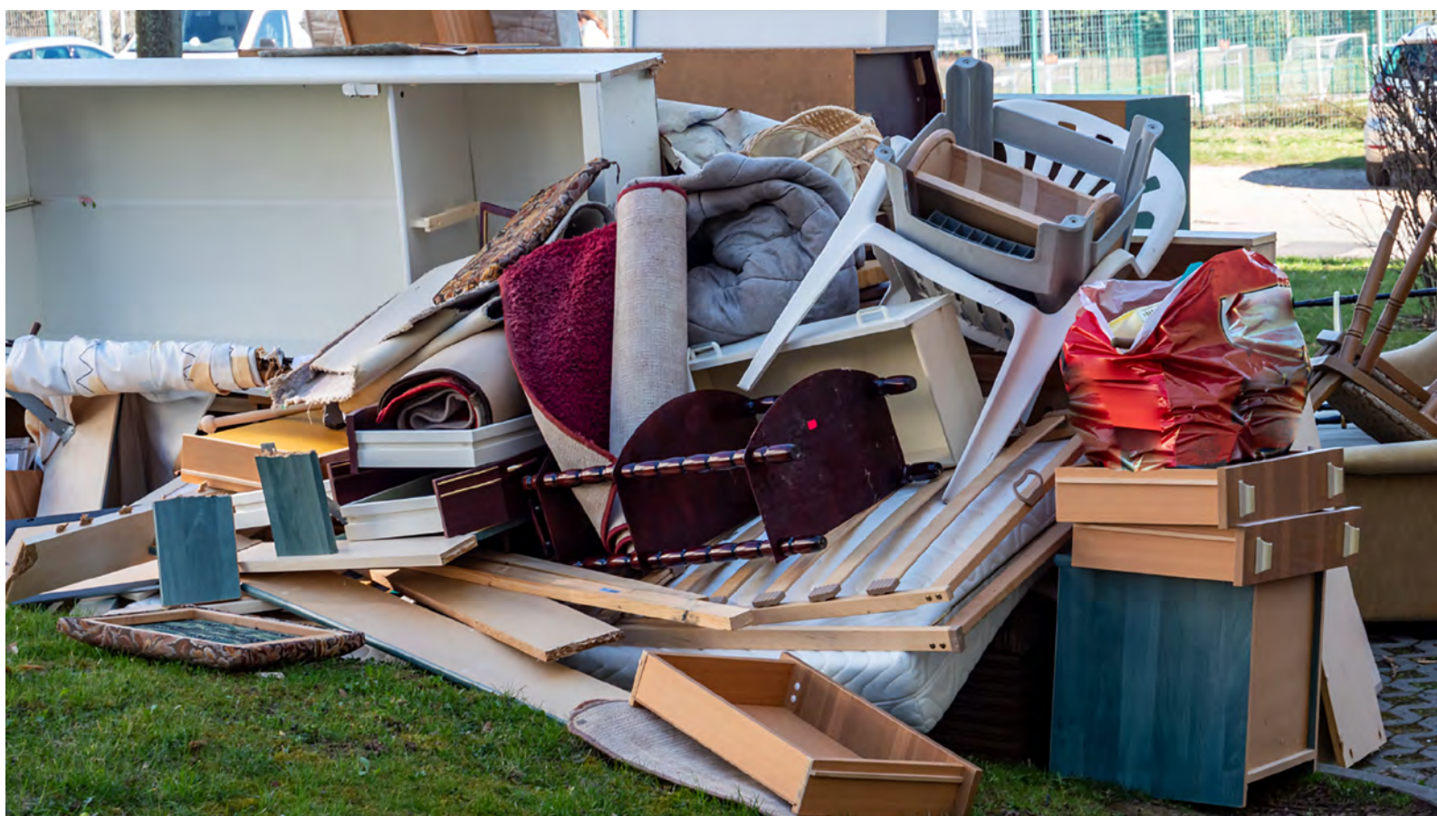
Moins d'encombrants à enlever signifie moins de frais à supporter pour les locataires.

Parmi les incivilités constatées par les travailleurs de BinHôme, il y a la hausse des dépôts d'encombrants aux abords des immeubles et des espaces communs. De quoi faire vivre un enfer aux locataires et aux concierges.