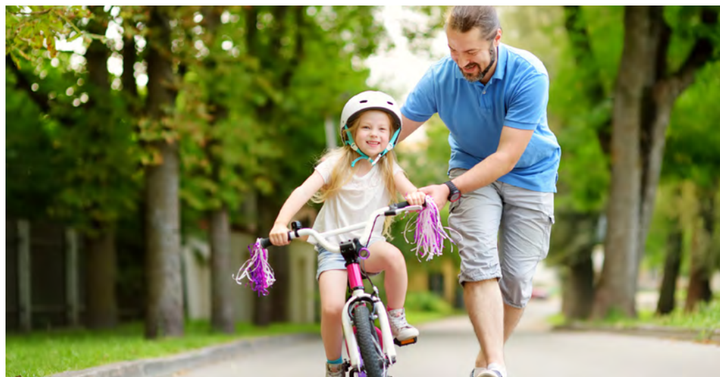
Louer, une alternative durable et bon marché à l'achat d'un vélo personnel.

Adresse : 43, avenue Paul Stroobant 1180 Uccle T. 02/605.12.18 Mai : velothequeuccle@gmail.com