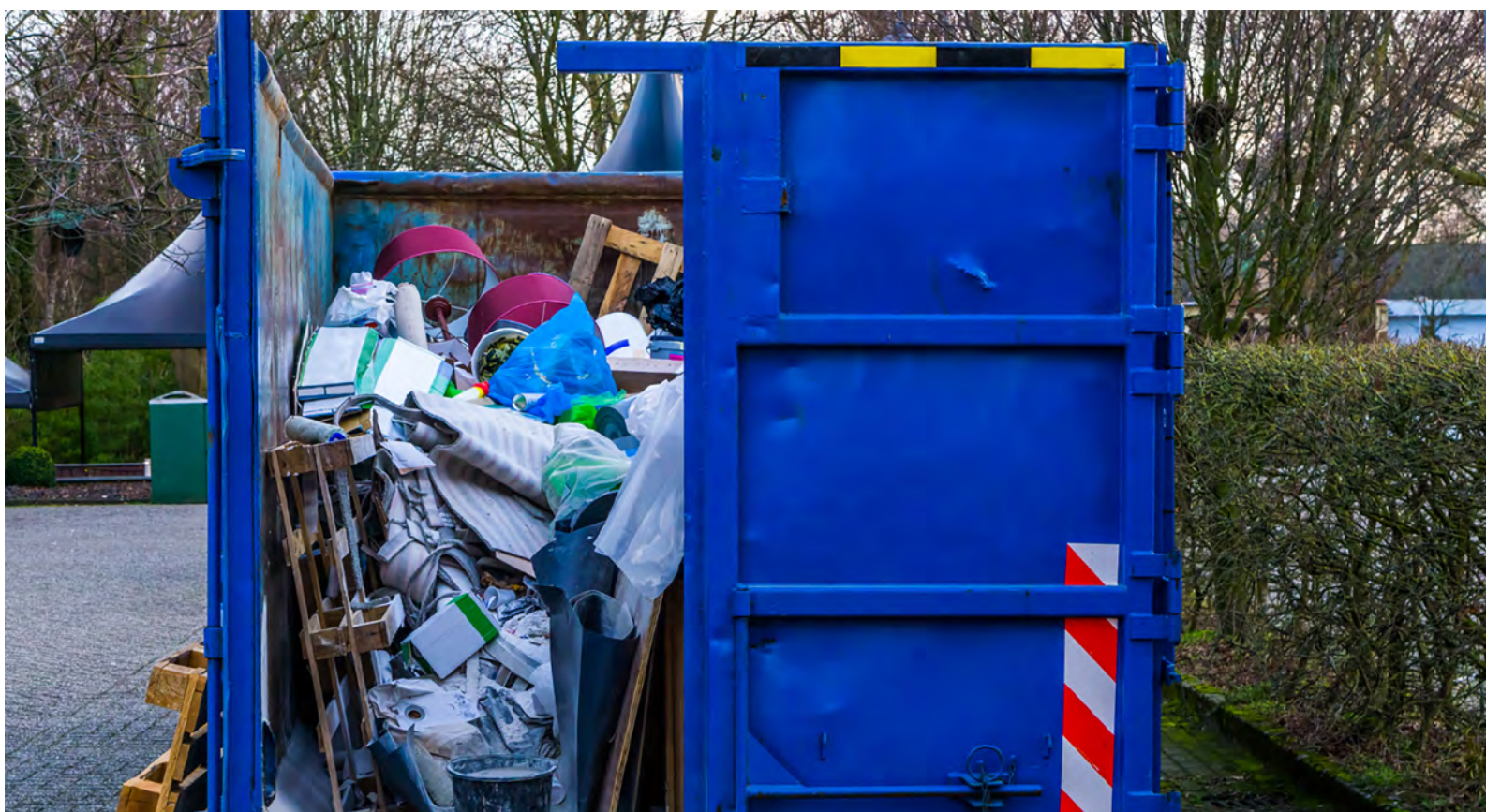
Plutôt que de jeter, vous pouvez faire un don de vos affaires aux entreprises d'économie sociale.