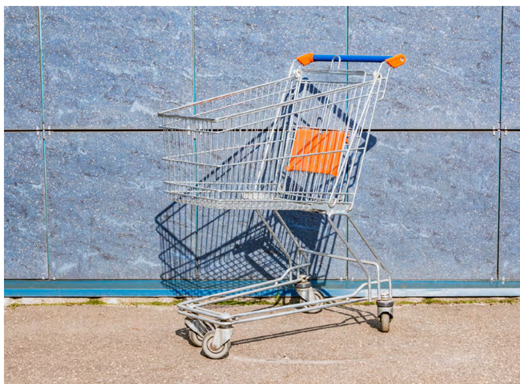
Le fléau des caddies qui encomrent les espaces communs.

caddies de veiller à les ramener au supermarché. Pour information, les enseignes circonscrivent l'utilisation de leurs chariots dans leurs magasins et sur leurs parkings. •