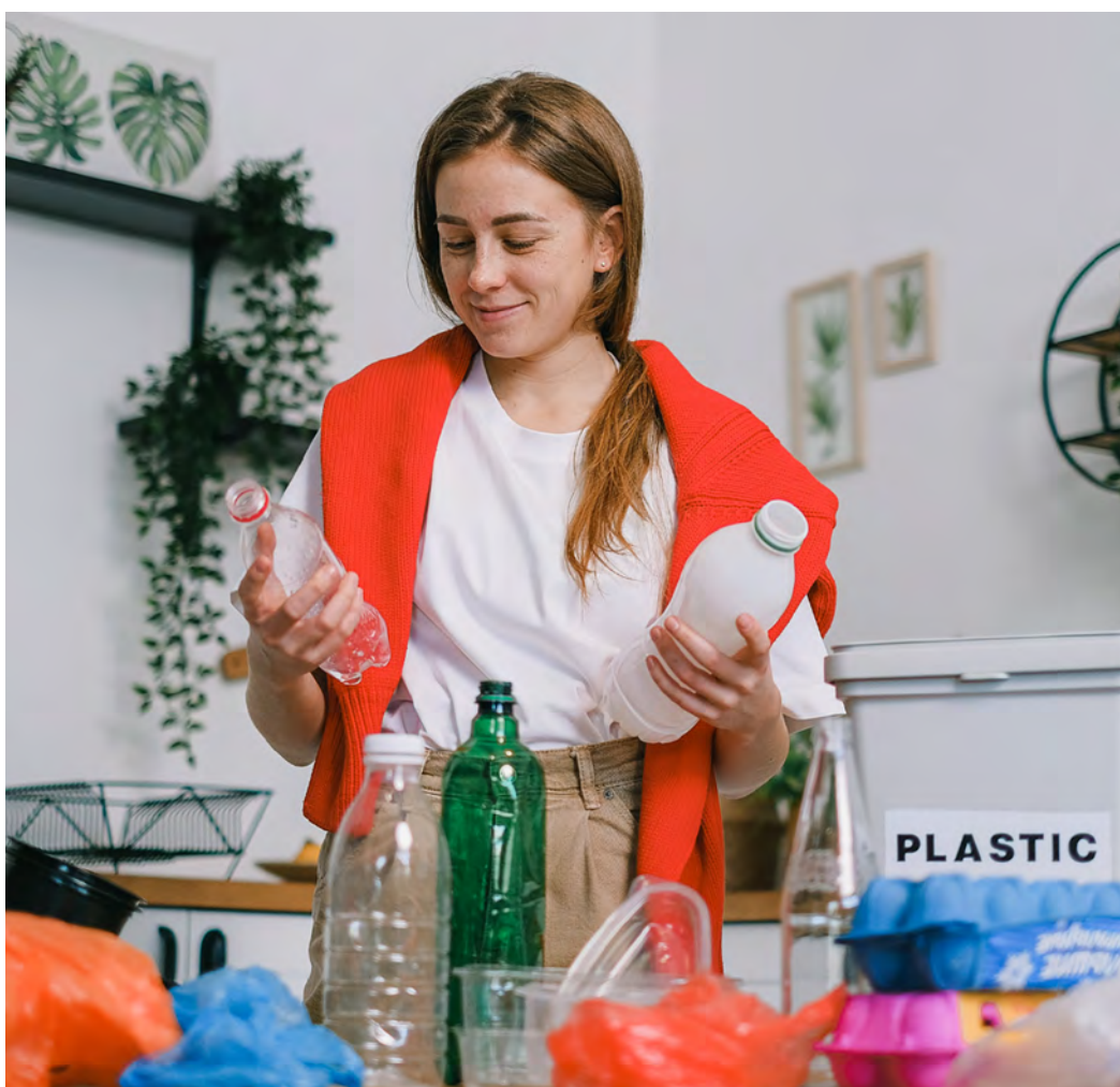
Trier ses déchets, c'est faire un geste pour la planète et les futures générations.

L'obligation du tri des déchets alimentaires depuis l'année dernière et l'apparition du nouveau sac bleu en 2021 ont bouleversé nos habitudes. Ce dossier consacré à la propreté est l'occasion de se rafraîchir la mémoire sur notre gestion des déchets.