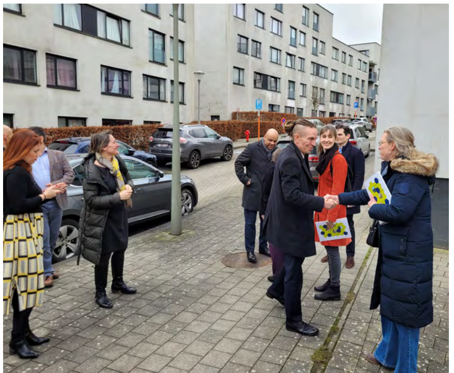
Le ministre tchèque Ivan Bartoš rencontre les acteurs du logement social.

Un échange enrichissant pour un avenir résolument tourné vers des solutions innovantes afin d'accroître l'offre de logements abordables en Europe. •